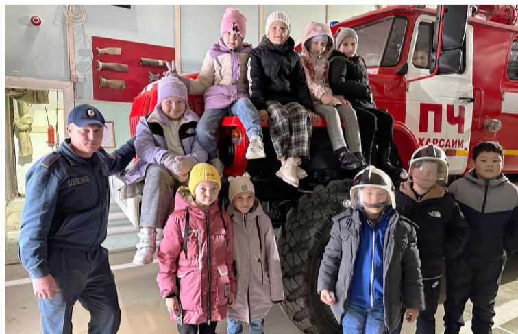
➤ Харсаимские школьники побывали в гостях у пожарных.

Школьники приуральских школ регулярно становятся гостями предприятий и учреждений, работающих в посёлках. Для детей организуют познавательные экскурсии и даже проводят интересные мастер-классы. Такая работа ведётся в школах района с целью ранней профориентации школьников.